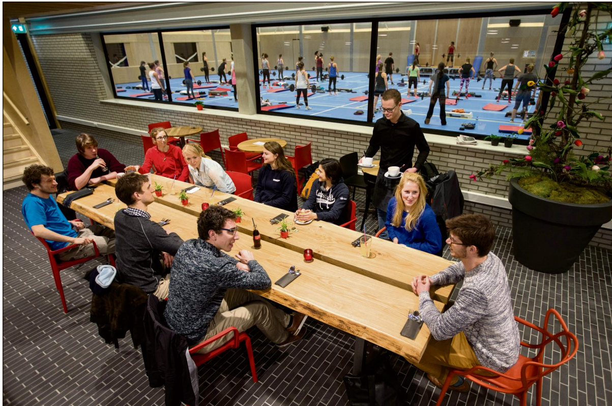
Studenten in de horecaruimte die het hart moet worden van het Universitair Sportcentrum in Randwyck.

studiecellen en werkruimten voor groepsstudie. Duijkaerts: „Het ideaalplaatje zou er zo uit kunnen zien: studenten komen naar het Universitair Sportcentrum om te fitnessen, te oefenen op de klimwand